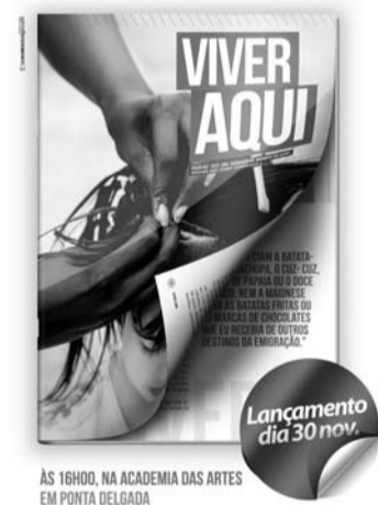
O lançamento aconteceu no âmbito do Festival “O Mundo Aqui”