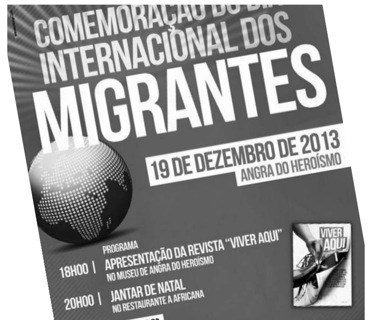
Será apresentada a Revista “Viver Aqui”

França, Itália, Macau, México, Moçambique, Moldávia, Polónia, Rússia, Ucrânia, Uruguai. A revista é gratuita e poderá ser adquirida na sede da AIPA em Ponta Delgada e em Angra do Heroísmo. A publicação da revista insere-se na III edição dos Projetos de Promoção da Interculturalidade a nível Municipal, co-financiado pelo Fundo Europeu para a Integração de Nacionais de Países Terceiros, com o apoio do Governo dos Açores. ♦